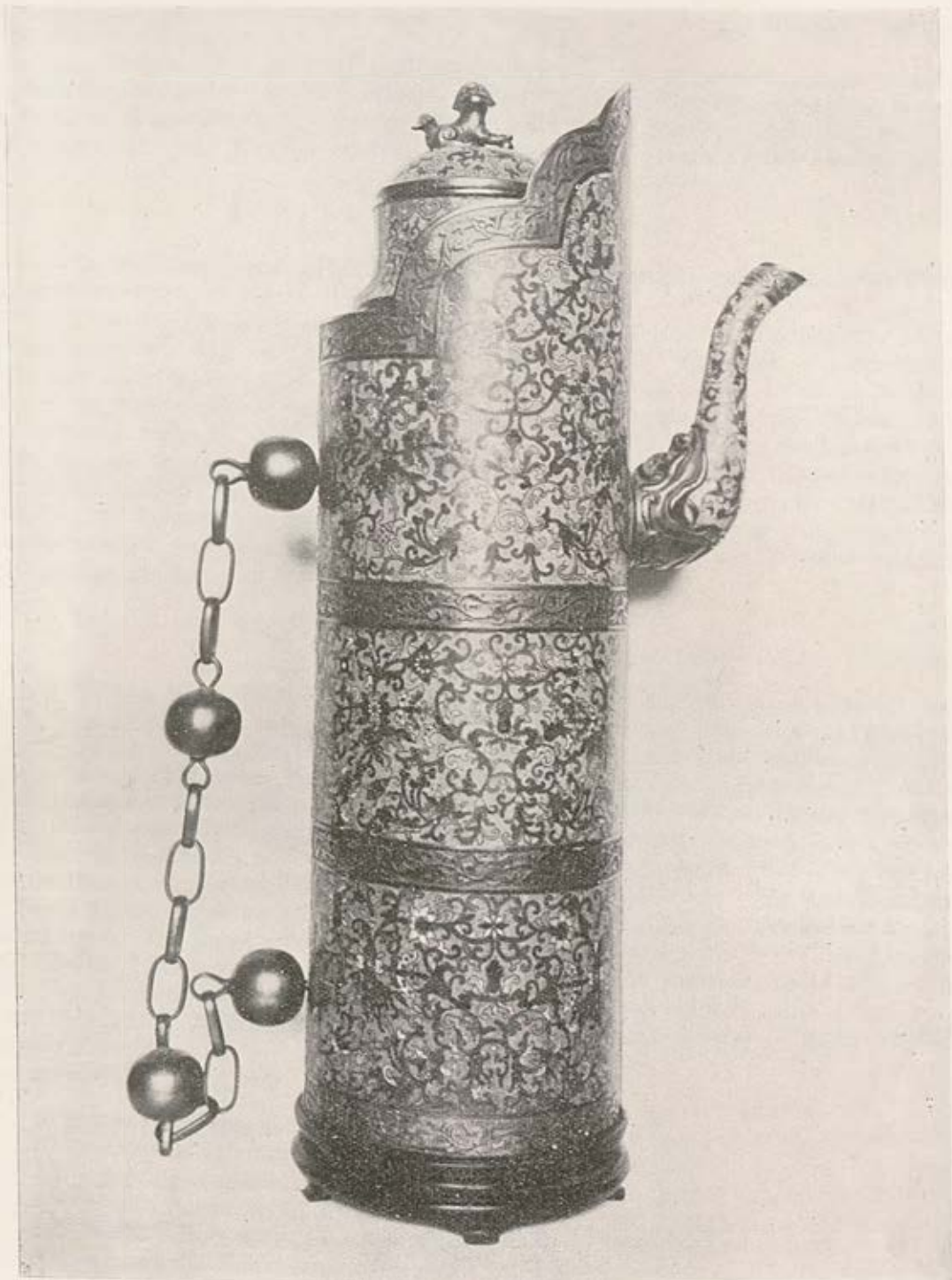
Buire Mongole, Cloisonnés Kienloug