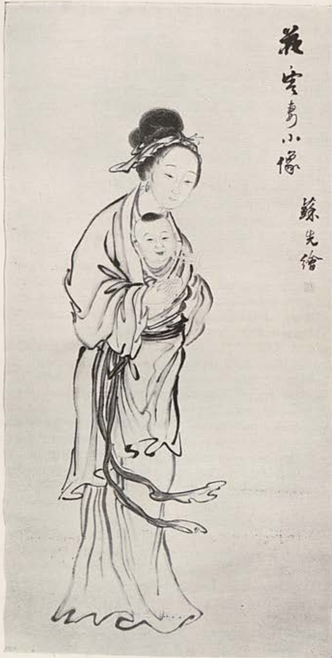
Sou Sie Mère et enfant