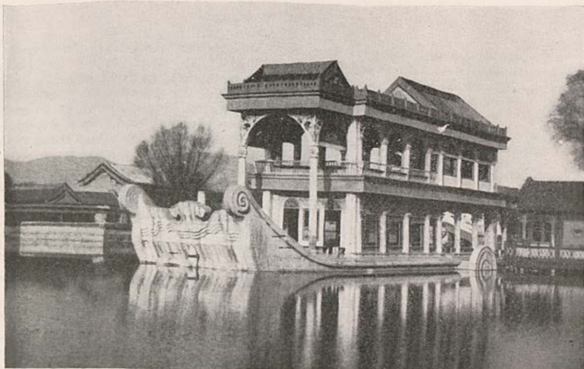
Parc du Palais d'Été à Peiping - Bateau de Marbre