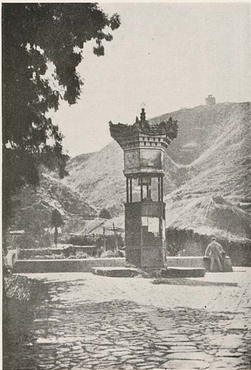
Provinz Tsche-kiang. Lampenturm.