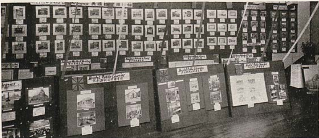
Différents aspects de l'Exposition Internationale des Bibliothèques