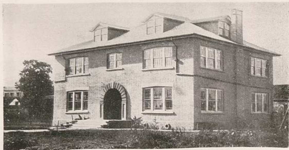
Musée d'histoire naturelle. Academia Sinica Nankin.