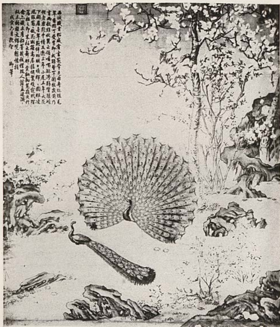
Les Paons. Paravent sur soie par Llan-Sse-Nin