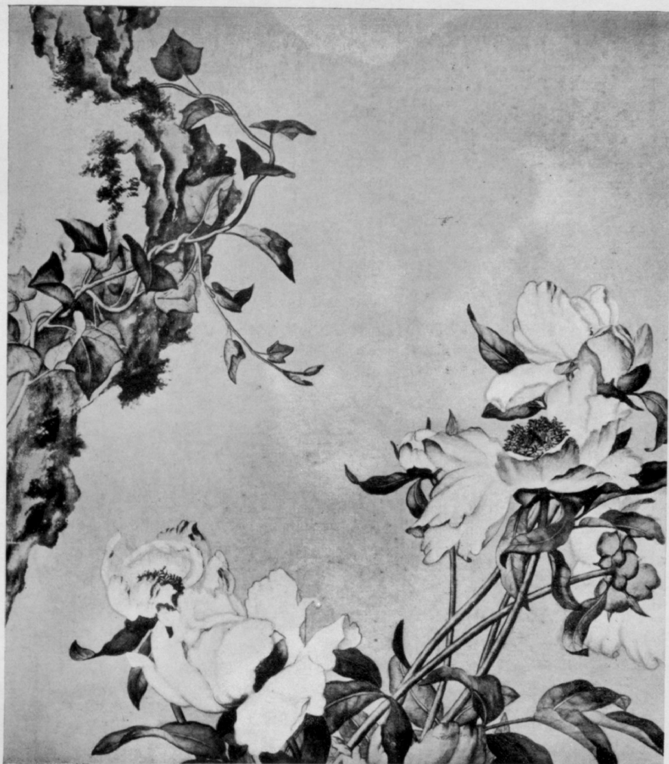
Nao-tai. Fleur porte-bonheur chinoise par Llan-Sse-Nin.

Ne pas se corriger après une faute involontaire, c'est commettre une faute véritable.