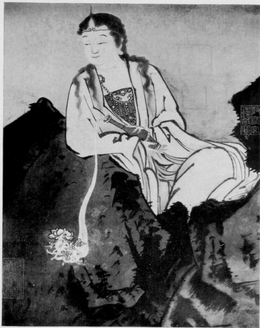
La déesse Kwan-Yin par Chia Shih-Kou, 12 e siècle.

Qui poursuit de petits avantages, néglige les grandes choses. (Confucius)