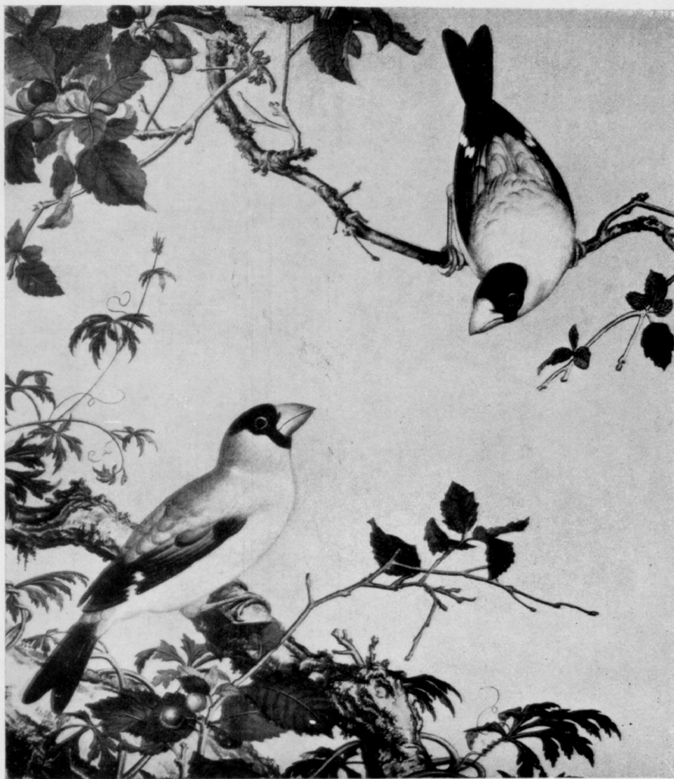
Oiseaux par Llan-Sse-Nin.

A force d'étudier les vieilles choses, on comprend les nou- velles. (Confucius)