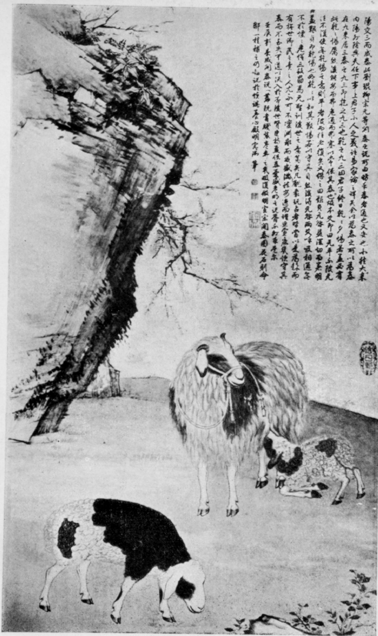
Heureux Nouvel-An Sous l'empire de Ch'ien Lung, 18 e siècle.

Celui qui s'avance avec trop d'empressement, reculera bien- tôt. (Meng-tseu)