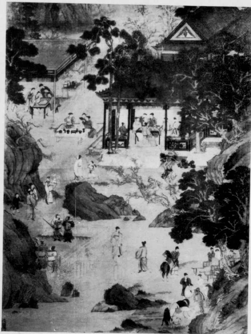
Les dix-huit savants au pays enchanté par Ch'iou Ying, 16 e siècle.

Les beaux discours font prendre le vice pour la vertu.