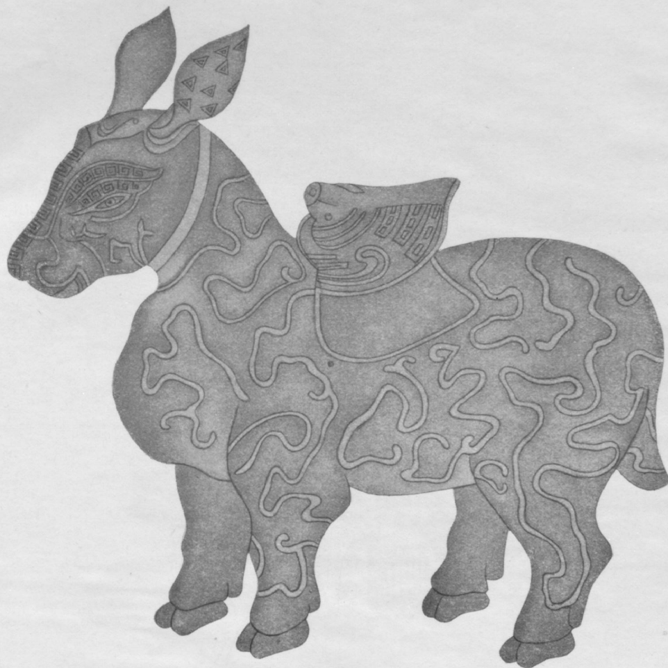
Porcelaine Lung-Ch'üan (dynastie Sung)