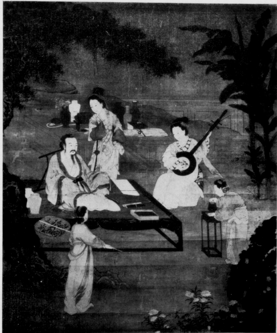
Jouant de la guitare par Li Soung, 12 e et 13 e siècle.

Tout passe comme l'eau; rien ne s'arrête ni jour ni nuit.