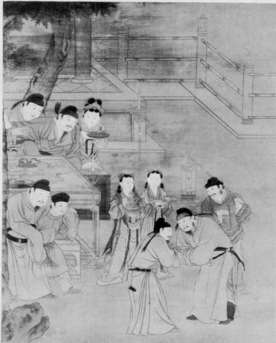
Le refuge des cinq princes buveurs par un artiste inconnu de la dynastie Ming.

On ne traite un homme avec mépris qu'après qu'il se soit traité lui-même sans respect.