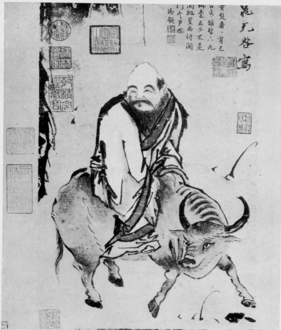
Laotsé montant un bœuf par Ch'ao Pou-chih, 1053-1110.

Celui qui connaît les autres, est intelligent, Celui qui se connaît soi-même, est un sage. (Lao-tse)