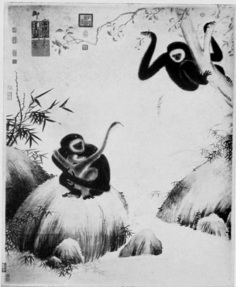
Jeux de singes. (1398-1435)

Si les souliers grands ou petits se vendaient tous au même prix, qui voudrait en faire des grands? (Meng-tseu)