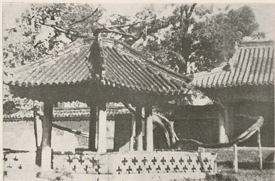
La fontaine de Lou Hong près du temple de Yen Hui