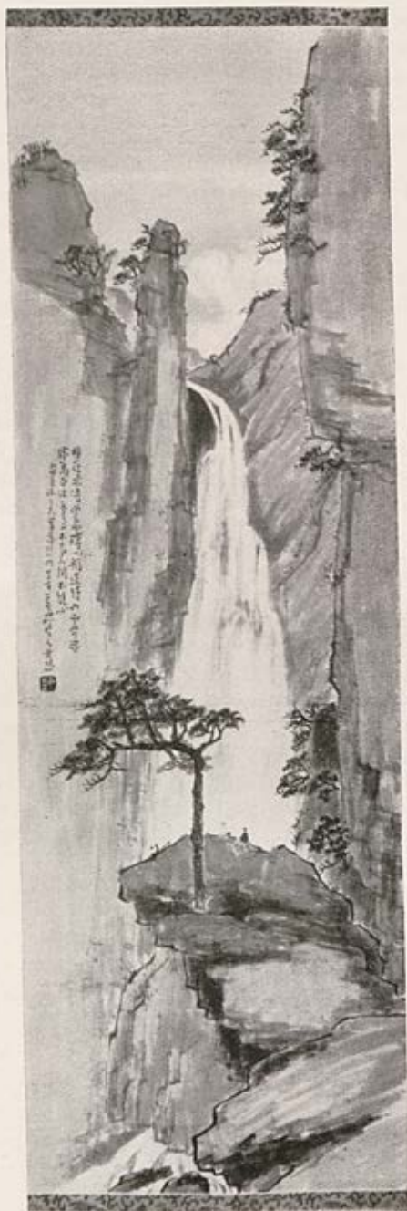
Paysage (Province de Kwang-Si)