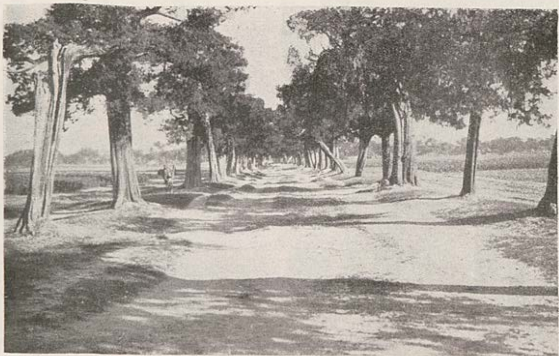
Allée conduisant au tombeau de Confucius