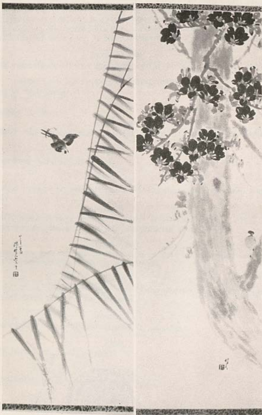
Moineau Chen-Shu-Yen Fleurs